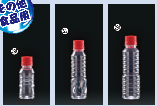
228) TSR-50 35φ×H91(57ml) 500入 材質:本体PET・CAPPP 229) TSR-80 35φ×H128(88ml) 500入 材質:本体PET・CAPPP 230) TSR-100 38φ×H131(109ml) 500入 材質:本体PET・CAPPP