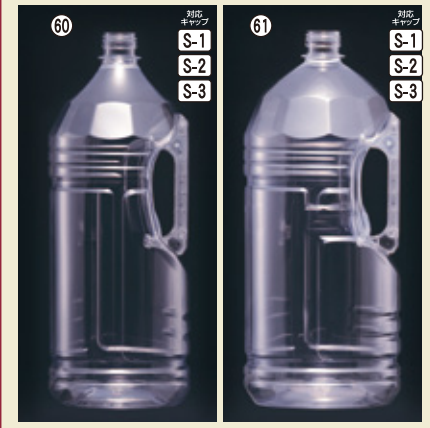
60) G-PET 4L丸 142φ×H370(4,000ml) 36入 材質PET 61) G-PET 5L丸 156φ×H370(5,000ml) 30入 材質PET