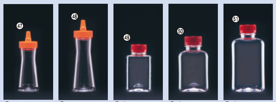
47) FTP280 本体+横とんがり大CAP+バッキンセット 65φ×H147(280ml) 216入 材質:本体PET・CAP PP 48) FTP360 本体+横とんがり大CAP+バッキンセット 70φ×H172(360ml) 159入 材質:本体PET・CAP PP 49) 角150 本体+ロックCAPセット H101×W57×L40(150ml) 660入 材質:本体PET・CAP PE 50) 角180 本体+ロックCAPセット H107×W60×L44(185ml) 600入 材質:本体PET・CAP PE 51) 角360 本体+ロックCAPセット H137×W70×L53(365ml) 312入 材質:本体PET・CAP PE