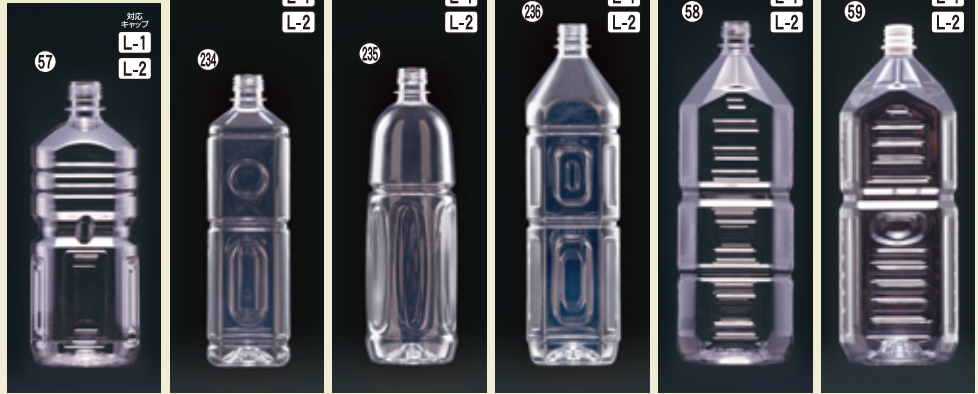
57) 1L-SG ミネラル 90φ×H227×W76(1,000ml) 130入 材質PET 234) 1L-TK ミネラル角 73φ×H255(1,000ml) 126入 材質PET 準耐熱 235) 1L-TK ミネラル丸 83.5φ×H267(1,000ml) 112入 材質PET 準耐熱 236) 1.5L-TK ミネラル角 84φ×H305(1,500ml) 84入 材質PET 準耐熱 58) 2L-SG ミネラル角 105φ×H305×W89(2,000ml) 70入 材質PET 59) HTK 2000-D3角 107φ×H303×W88(2,000ml) 70入 材質PET 耐熱