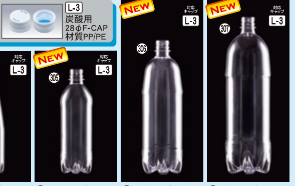
304) 炭酸用PETボトル 350S H206×W60×L60(350ml) 200入 材質PET 305) 炭酸用PETボトル 500S H206×W66×L66(500ml) 180入 材質PET 306) 炭酸用PETボトル 1000K H261×W82×L82(1,000ml) 80入 材質PET 307) 炭酸用PETボトル 1500G H305×W93×L93(1,500ml) 64入 材質PET