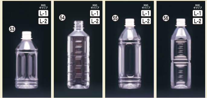
53) HTM-350丸 67φ×H163(350ml) 288入 材質PET 耐熱 54) MK-500角 64φ×H189(500ml) 243入 材質PET 55) HTM-500丸 64φ×H205(500ml) 216入 材質PET 耐熱 56) HTK-500角 H205×W60×L60(500ml) 243入 材質PET 耐熱