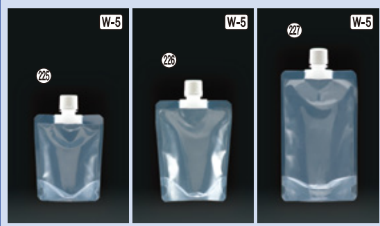
225) スパウト-100 CAP付 H126×W100(100ml) 750入 材質:本体PE・CAP PP 耐熱 226) スパウト-200 CAP付 H166×W110(200ml) 750入 材質:本体PE・CAP PP 耐熱 227) スパウト-300 CAP付 H206×W110(300ml) 500入 材質:本体PE・CAP PP 耐熱